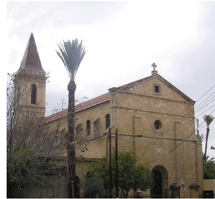
Католическая церковь Честного Креста

Редактирование: МЕТЕКСИС Культурные дьяконы: Дизайн: Хараламбос Хараламбидис Перевод с греческого: Др. Даниела Вуюка Дизайн логотипа: священник Демосфен Демосфенус Текст: Георгиос Филофеус, археолог Фотография на обложке: Кипрская Туристическая Организация Карты: Департамент земельной регистрации Кипра Источники: Сборник “Кипр – остров святых. Путеводитель паломника”, издательство Кипрской туристической организации, Никосия, 2008 г.