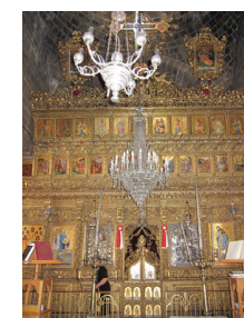
Интерьер храма св. архангела Михаила Трипиотис