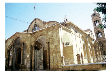
Храм Божией Матери Фанеромени

Понедельник-суббота: 06:30 - 13:00, апрель – октябрь: 16:00 - 20:00 / ноябрь - март: 15:00-18:30 и 06:00-12:00; воскресенье: 06:00 - 12:00 (в воскресенье после полудня храм открыт только когда есть богослужение) тел. 22673296, 22660761