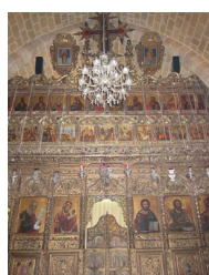
Интерьер храма святого Антония