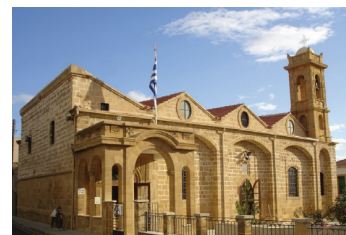
Храм св. Саввы

Ежедневно: 06:00-12:00 и 15:30-18:00 (Среда и воскресенье после полудня закрыто), Тел. 22755120