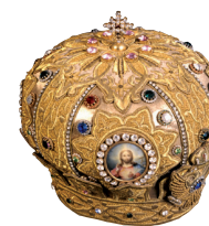
Архиерейская митра Архиепископа Макариоса III (1950-1977)

Кипрский музей , ул Мусиу, 1, тел 22865854, Культурно-духовный центр фонда им. Арх. Макария III, Музей византийского искусства и галерея . Архиепископский дворец, площадь арх. Киприана, тел. 22430008, Этнографический музей Кипра , площадь арх. Киприана, тел.22432578, Музей освободительного движения , площадь арх. Киприана, тел.22305878, Музей Всекипрской гимназии , угол ул. Аг. Иоанну и ул.Фисеос, тел. 22466014, Городской центр искусств , ул. Палеас Илектриксис 19, тел. 22797400, Культурный центр Хрисалиньотисса , ул. Димонактос 2, угол ул. Иппонактос, тел. 22347465, 99629611, Ворота Фамагусты , Просп. Афинон, тел. 22797660, Этнологический музей – покой драгомана Хаджийоргакиса – Корнесиос , ул. Патриарха Григория 20, тел. 22305316, Культурный фонд Банка Кипра , Ул. Фанеромени 86-90, 1011, тел. 22128157, Мечеть Омерие , ул.Трикупи и площадь Тиллириас, Кастелиотисса , Средневековый зал, Никосийский городской музей Левендиса , ул. Ипократус 17, Лаики Питона, тел. 22661475, Обсерватория улицы Лидра , ул. Лидра, башня Шаколаса, тел. 22679369, Музей коллекции Йоргоса и Нефели Дзобра-Перидис , Фанероменис 86-90, тел. 22128457, Музей почты Кипра , ул. Агиу Савва, 3В, тел. 22760522 Арт-музей Лукии и Михалакиса Замбеллас , проспект Арх. Макариоса III, 27, Каймакли, тел. 22456098.