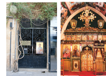
Храм святого Елевферия, подворье монастыря Махеры

Часы работы: 08:00-12:00 и 16:00-18:00 Тел: 22664737, 22363824, 22680722