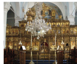
Интерьер храма Божией Матери Фанеромени