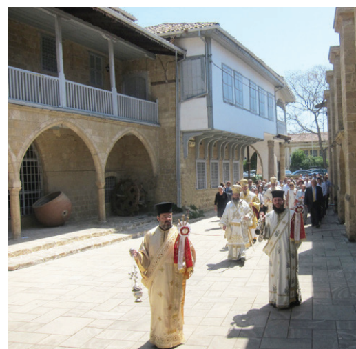
Литания во время вечерни агапе в кафедрального собора св. Иоанна Богослова

Понедельник – пятница: 9:00-16:30 / суббота: 9:00-13:00 тел: 22430008