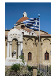
Мавзолей героев – мучеников