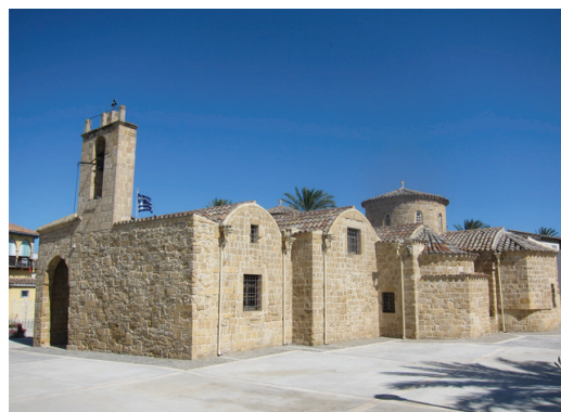
Храм Божией Матери Хрисалиньотиссы (вид с восточной части храма)

Летние часы работы: 08:30-12:30 и 16:00-19:00 Зимние часы работы: 08:30-12:30 и 14:00-17:00 тел: 22430857