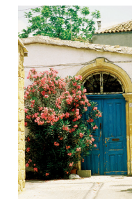
Дверь из старого города Никосии