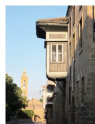
Храм святого Антония