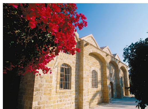
Храм святого Кассиана

Информация по телефону: 99477442 (г-н Фивос Георгиадис) и 99871126 (г-н Христинис Христу)