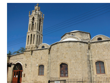
Храм св. архангела Михаила Трипиотис (восточной вход храма)

Апрель – октябрь: 07:00-12:00 и 17:00-18:30 / ноябрь - март: 07:00-12:00 и 16:00-18:00 (Среда и воскресенье после полудня закрыто), тел. 22663601