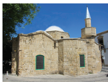
Храм Честного Креста Мисирику

Ежедневно: понедельник-суббота: 07:00-11:00/апрель-август: 16:00-18:30/ сентябрь – март: 15:00-16:00. Тел. 22432838