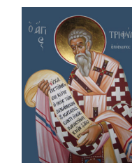
Св.Трифиллий епископ Лидрский (Никосия), Часовня апостола Варнава, Архиепископия