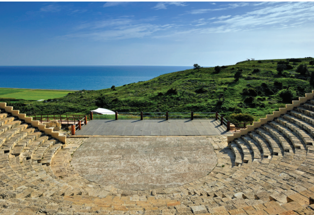
Das Theater von Kourion

Etwa 3 km von der archäologischen Stätte entfernt befindet sich rechts von der Straße das Heiligtum des Apollo Hylates. Hylates, der Hüter des Waldes, war der Schutzpatron der Königsstadt Kourion, der hier vom 8. Jahrhundert vor Christus bis ins 4. nachchristliche Jahrhundert verehrt wurde.