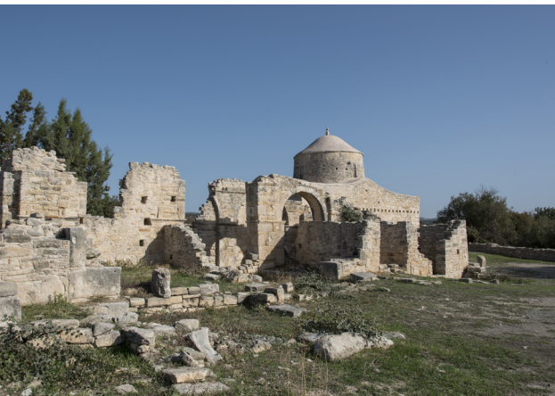
Timios Stavros, Anogyra

Machen Sie einen Spaziergang zum Dorfplatz, wo sich das einzige Johannisbrot-Museum (Carob-Museum) und die Johannisbrot-Fabrik befinden. Das Dorf ist besonders für die überlieferte Art der Herstellung von Pastelli, einer beliebten Süßigkeit aus der Frucht des Johannisbrotbaums, bekannt, zu deren Ehren hier alljährlich im September das Pastelli-Festival veranstaltet wird. Auch der Kalksteinbrunnen des Dorfes, der aus dem 14. Jahrhundert stammt, ist sehenswert.