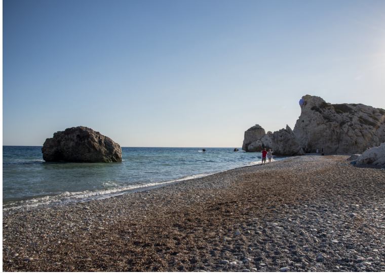
Petra tou Romiou

Romiou, eine faszinierende geologische Formation großer, hoch aufragender Felsen, die unter der Bezeichnung Aphrodite's Rock (Fels der Aphrodite) besser bekannt ist. Der Sage nach ist dies der Geburtsort der Aphrodite, der griechischen Göttin der Liebe und Schönheit, der Tochter des Göttervaters Zeus und der Dione, die hier den schäumenden Wogen entstieg, nachdem Sie in einer Muschel an Land gespült worden war, um hier ihr weltliches Leben zu beginnen. Dies ist wahrscheinlich eine der bedeutendsten Naturattraktionen der Insel und ein wichtiger Zwischenstopp auf der kulturellen