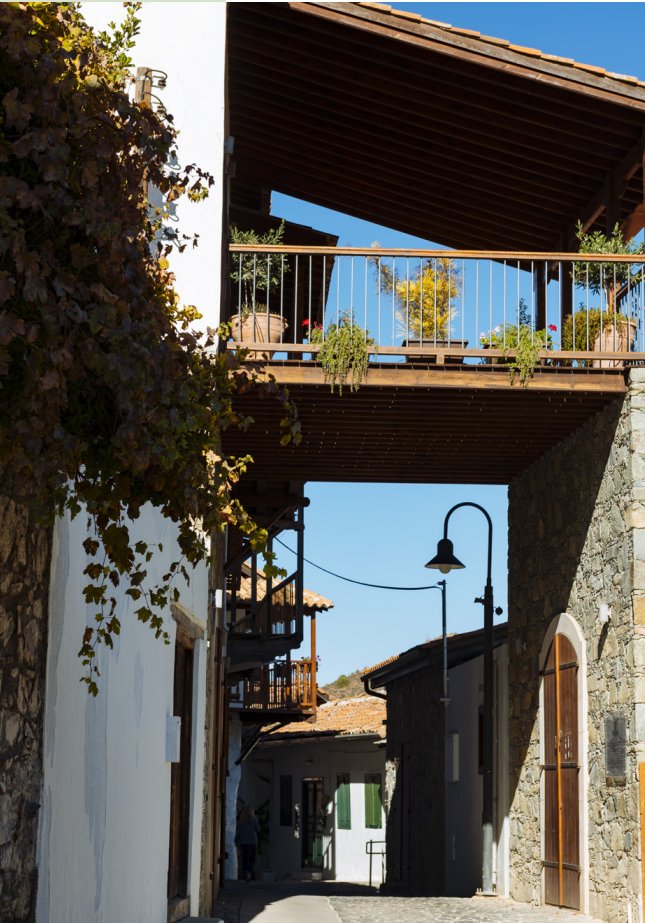
Kalopanagiotis - Nikosia

Hier wird man Sie aufs Wärmste willkommen heißen, nachdem die Zyprioten zu Recht den Ruf herzlichster Gastfreundschaft genießen. Und Sie werden sicher viele neue Freundschaften schließen, bevor Sie die Insel verlassen. Wundern Sie sich nicht, wenn Ihre Gastgeber keine Mühe scheuen, um Sie wie ein Familienmitglied zu behandeln und dabei ein üppiges Festmahl mit unzähligen heimischen Leckerbissen für Sie veranstalten.