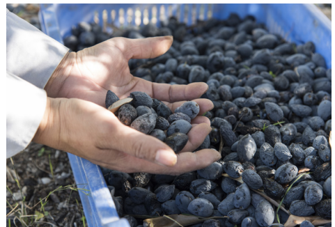
Olivenernte in Kantou

Fahren Sie dann weiter in Richtung Süden, vorbei am Kouris Damm nach Kantou mit seiner kleinen byzantinischen Kalkstein-Kapelle aus dem 16. Jahrhundert, ehe Sie nach Erimi weiterfahren. Sehen Sie sich unbedingt das Weinmuseum Zyperns an, das eine anschauliche Reise in die Geschichte der Weinherstellung auf der Insel Zypern bietet. Anhand traditioneller und