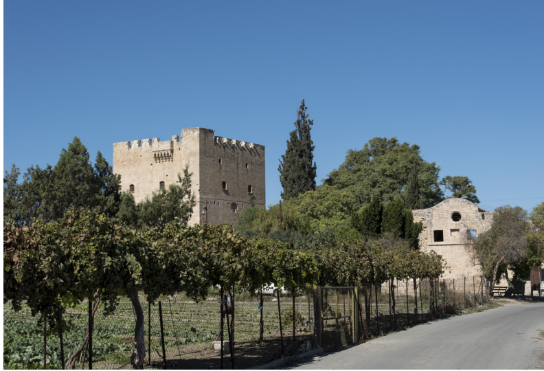
Burg von Kolossi

Fahren Sie auf derselben Straße wieder zurück und biegen Sie dann nach rechts zur Hauptstraße ab, die entlang der Küste verläuft und zu Ihrer Linken einen einmalig schönen Blick auf das unendliche Blau des Mittelmeers bietet.